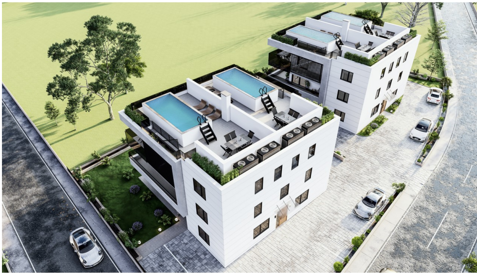
Visu - Außenansicht