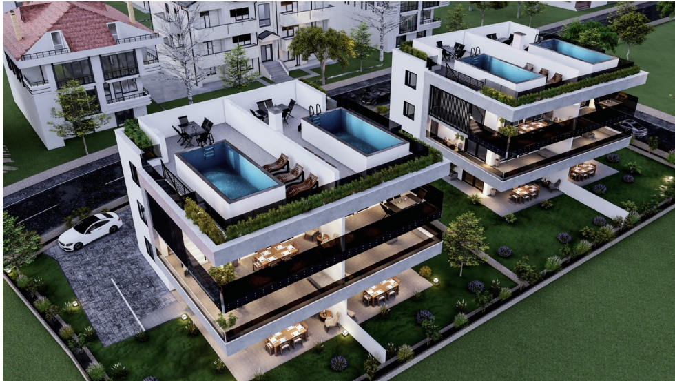
Visu - Außenansicht