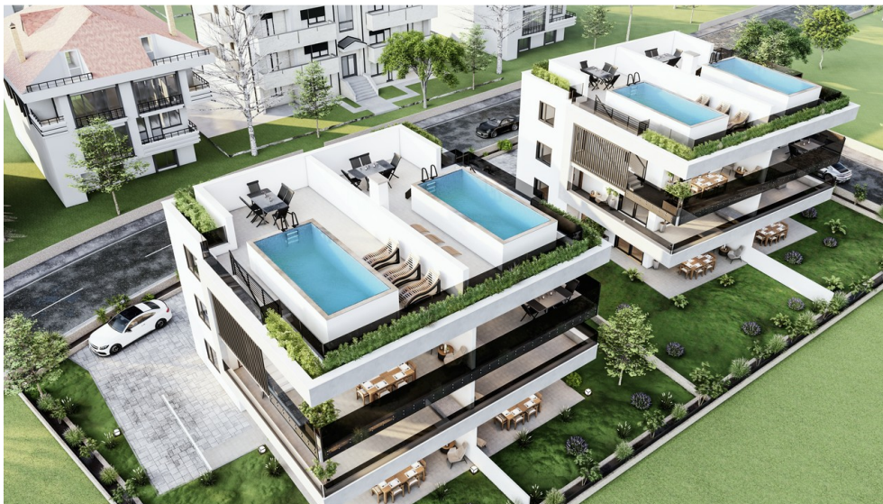
Visu - Außenansicht