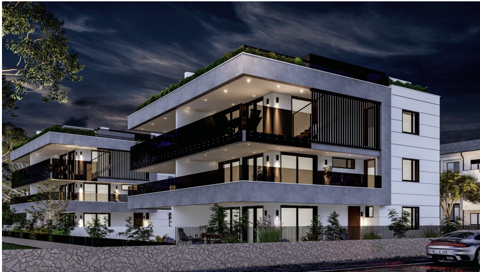
Visu - Außenansicht