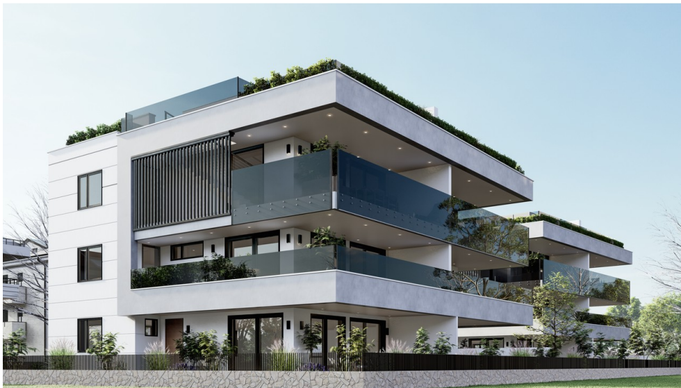
Visu - Außenansicht