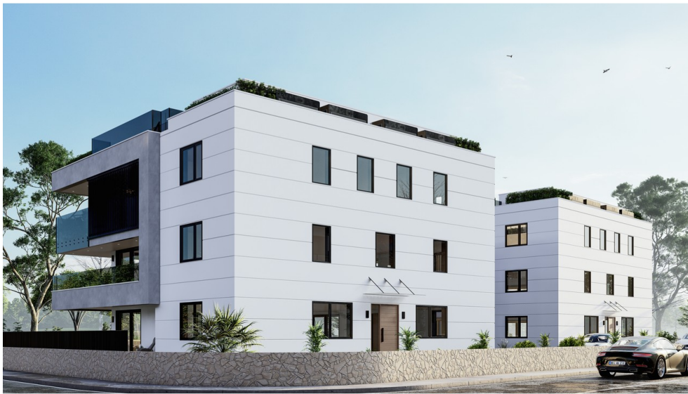
Visu - Außenansicht