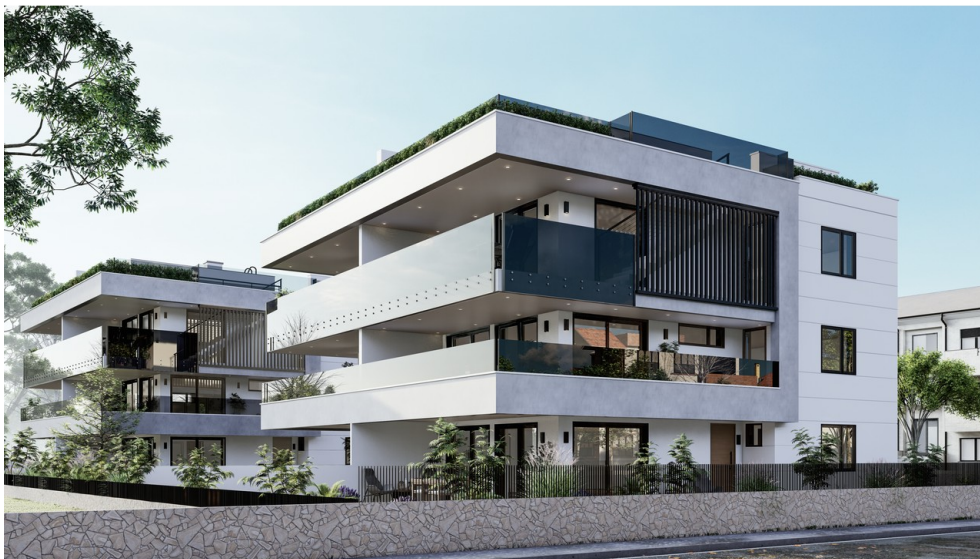
Visu - Außenansicht