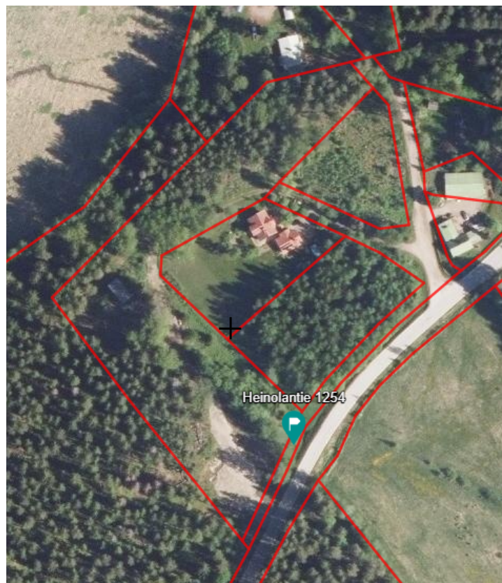
☒ Heinolantie 1254-lahti+2+