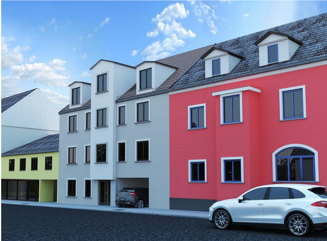
Außenseite 1 (Beispiel/Visu)