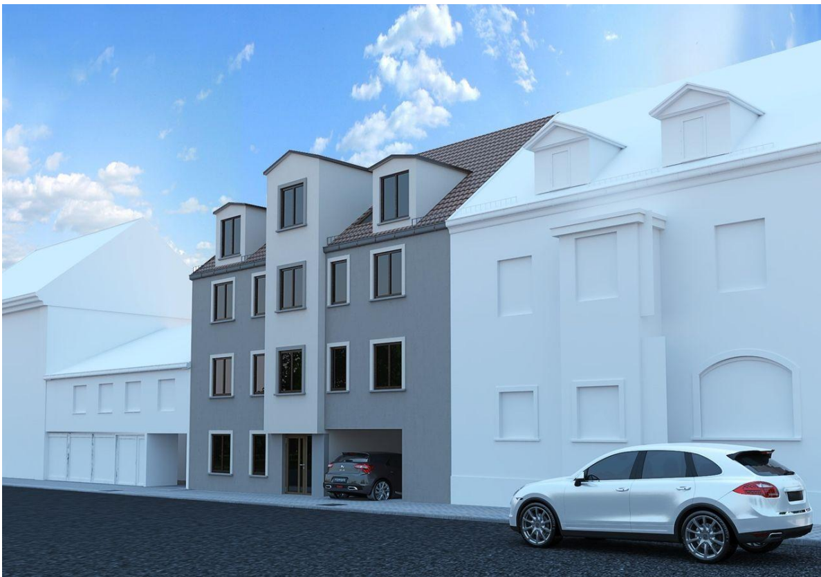
Außenseite 2 (Beispiel/Visu)