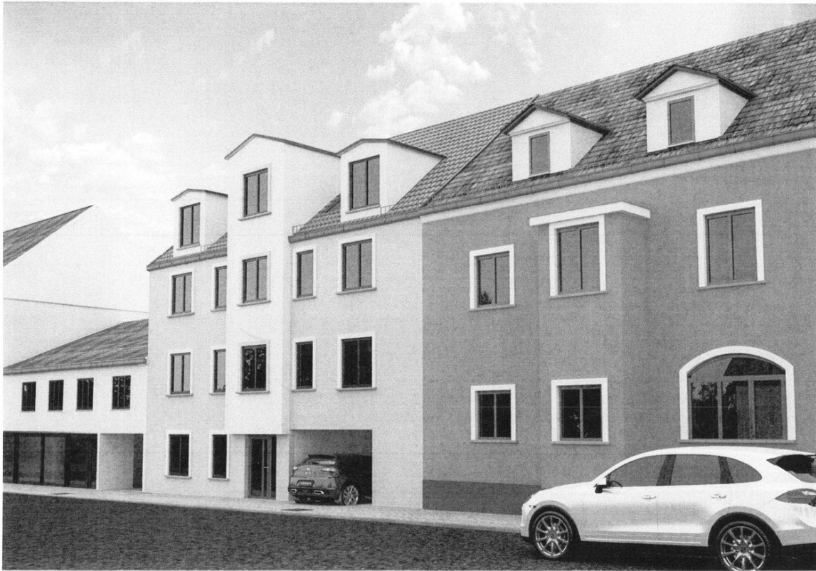
Ansicht außen Gebäude