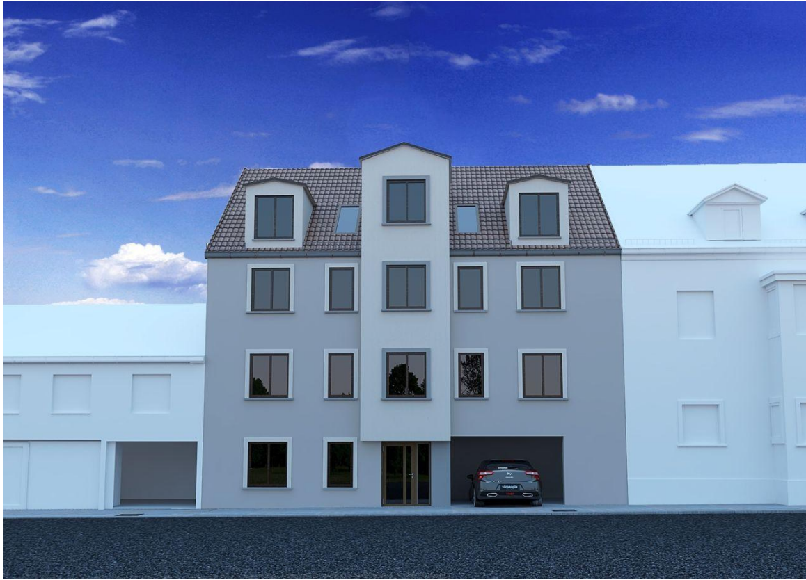
Außenseite 4 (Beispiel/Visu)