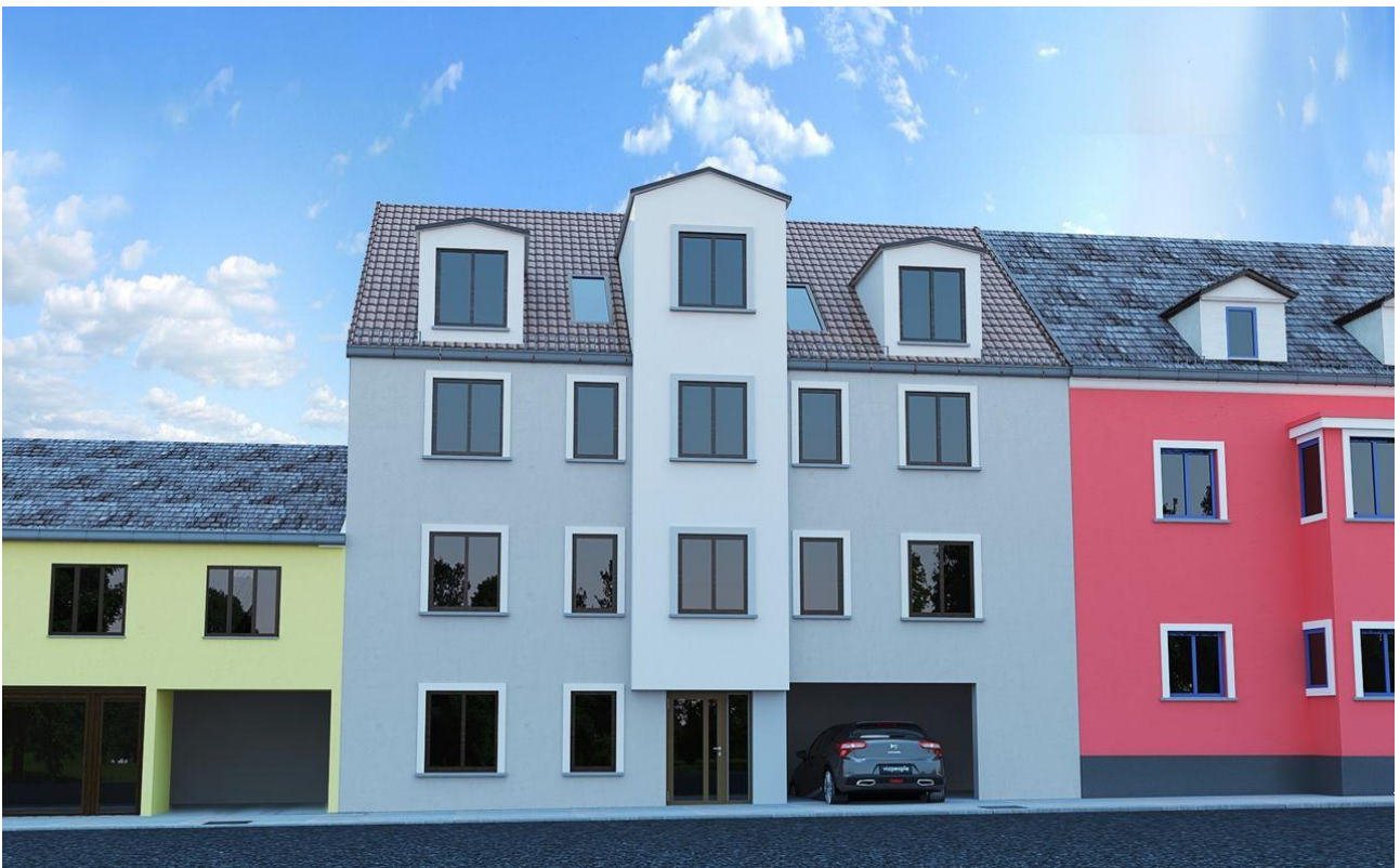
Außenseite 3 (Beispiel/Visu)