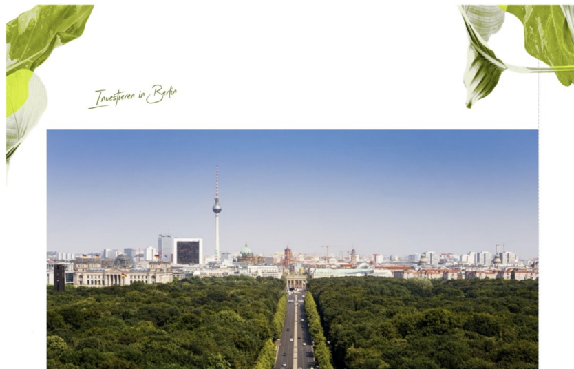
Investieren in Berlin