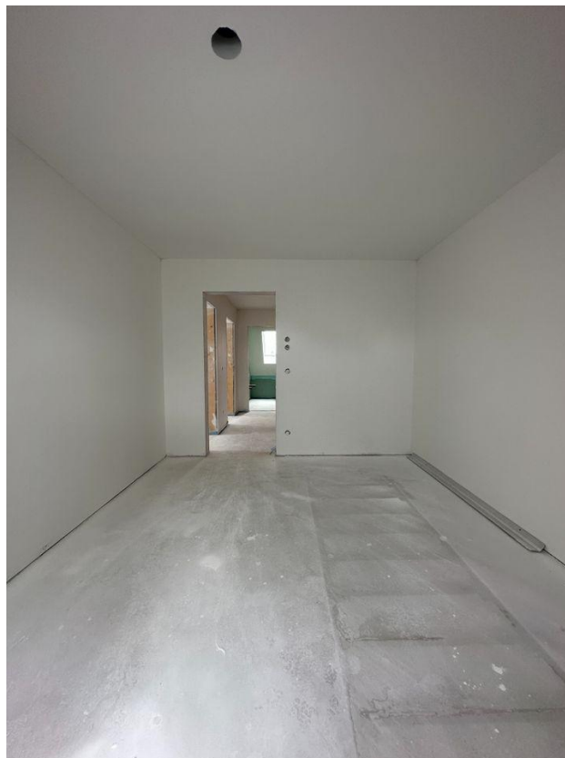
1. OG-Kinderzimmer 1