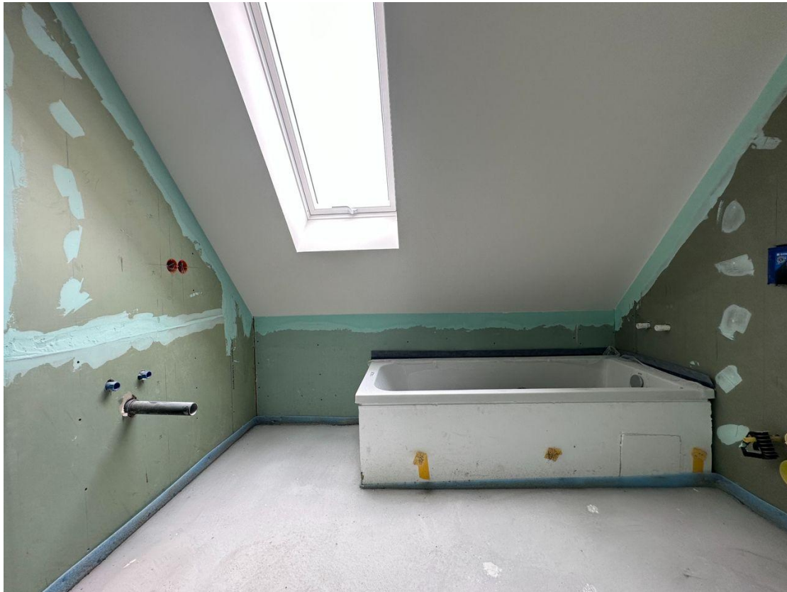
1. OG-Badezimmer mit Wanne