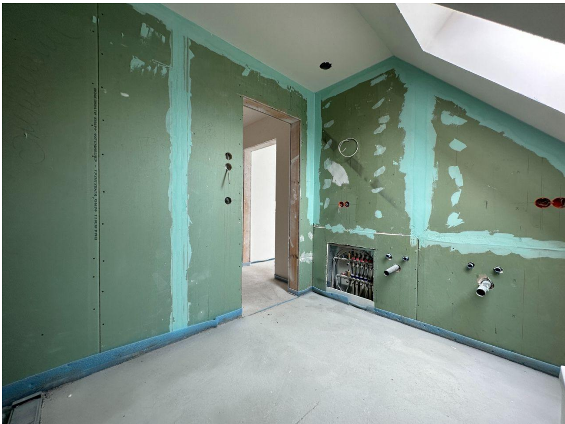
Badezimmer mit Dusche:Wanne