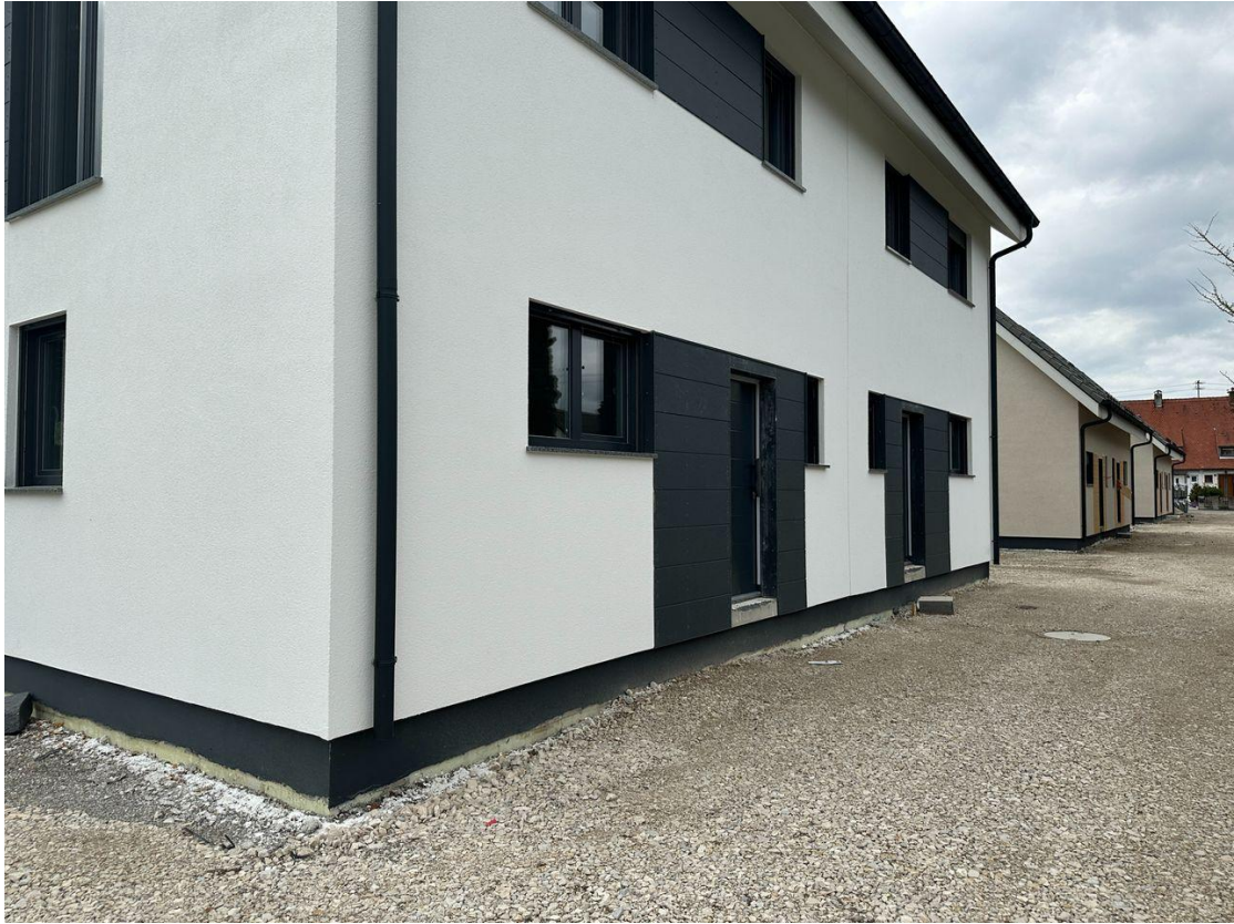
Zugang zum Haus