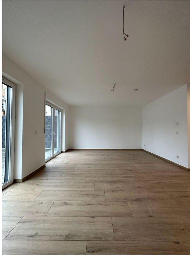
Wohn- und Essbereich-Beispiel