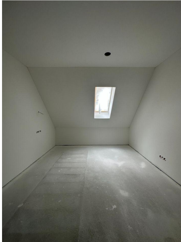
Kinderzimmer 1-1. OG