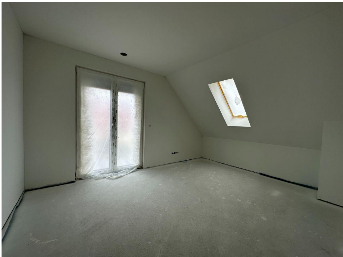
1. OG-Kinderzimmer 2