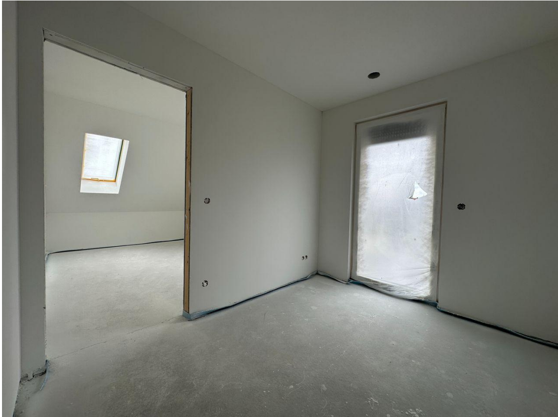
1. OG-Ankleide mit Schlafzimmer