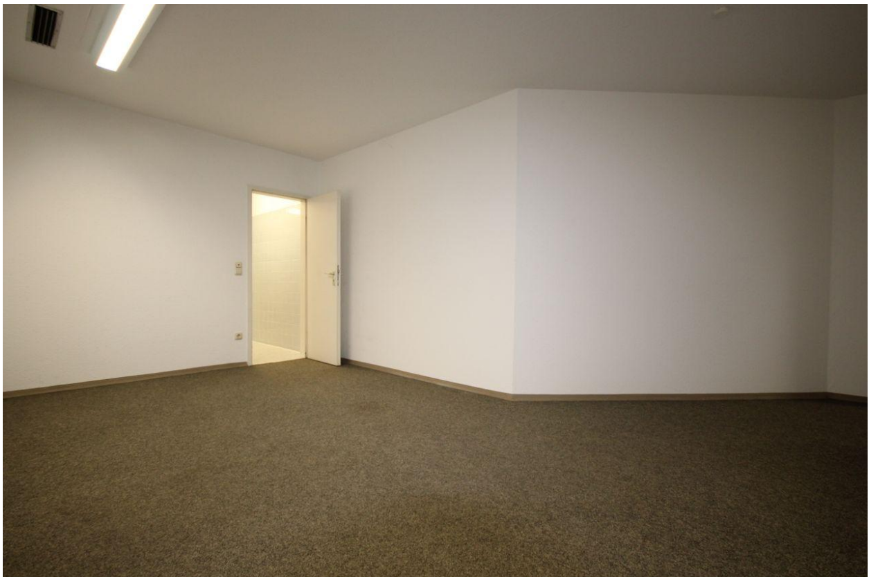
Ansicht im Eingangsbereich