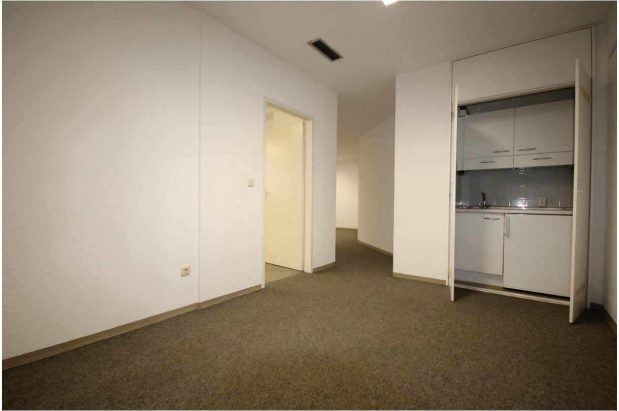
Flurbereich mit Teeküche