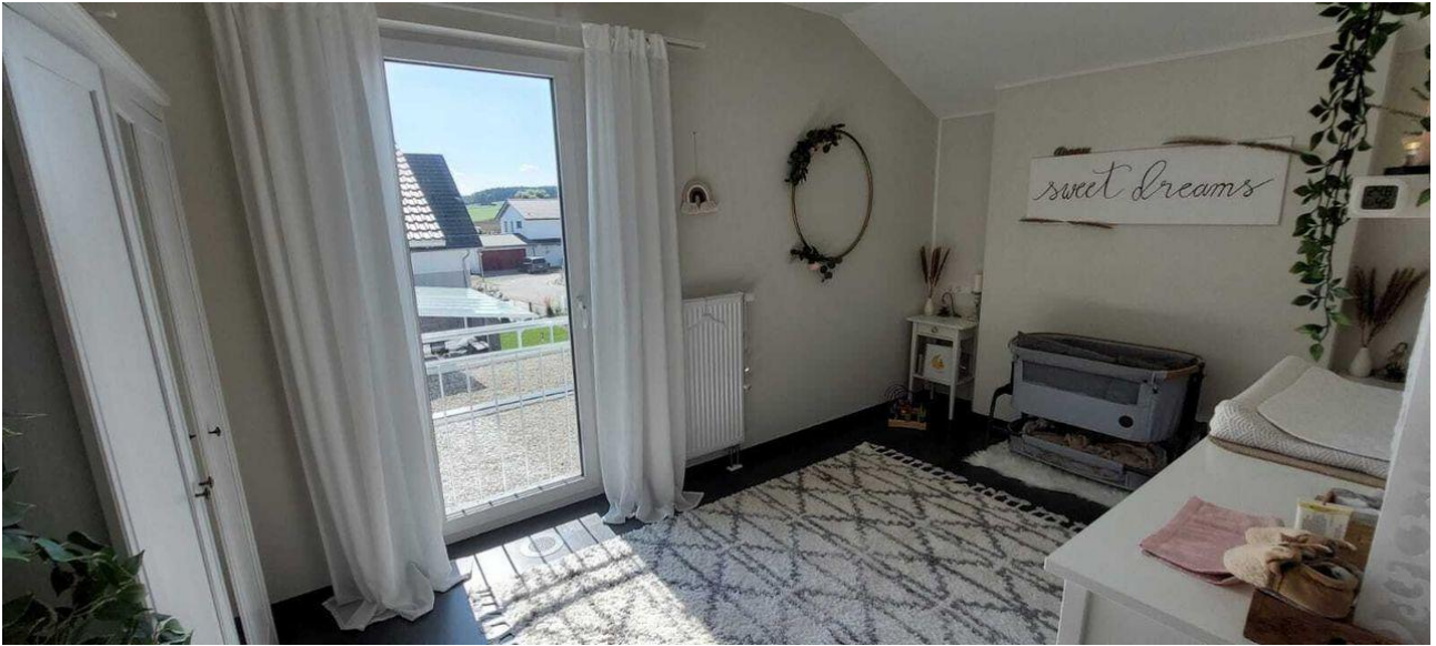
Kinderzimmer Ansicht 2