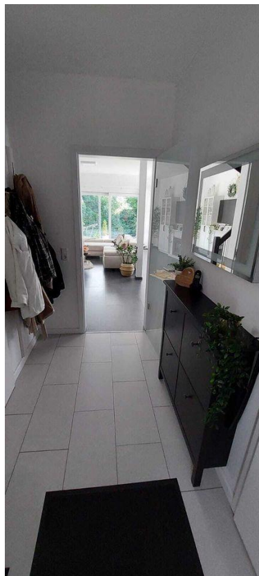
Flur Ansicht 2