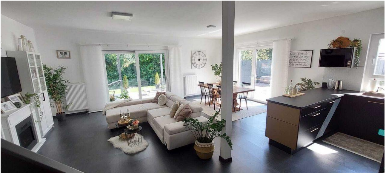
Wohnbereich Ansicht 3