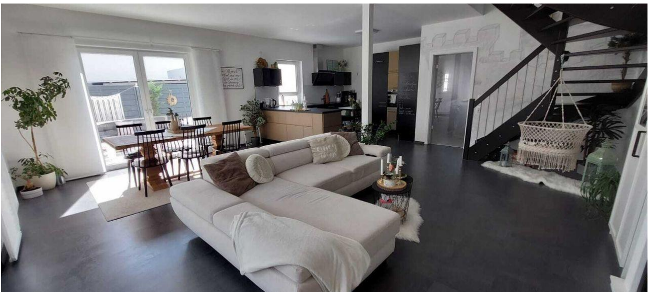
Wohnbereich mit Blick auf die Küche