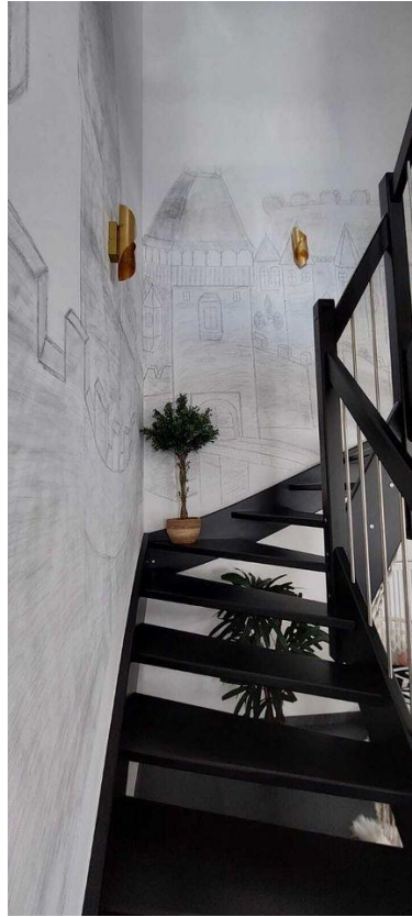
Treppenhaus Ansicht unten