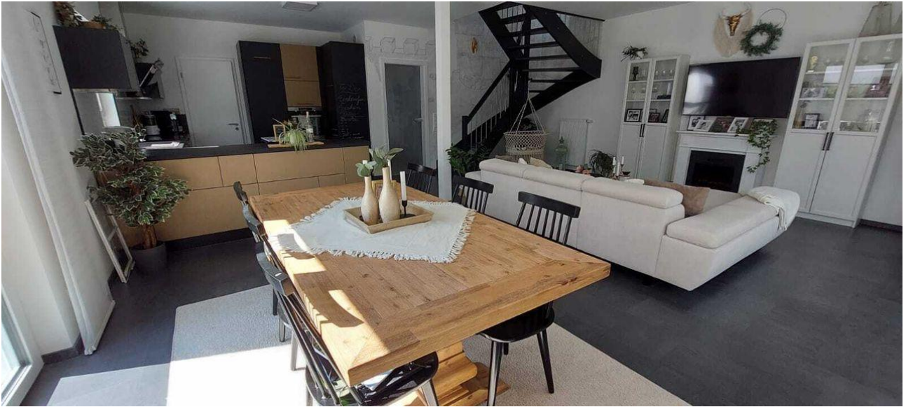
Essbereich mit Blick auf Küche und Wohnbereich