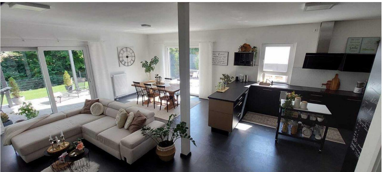
Wohnbereich mit Küche