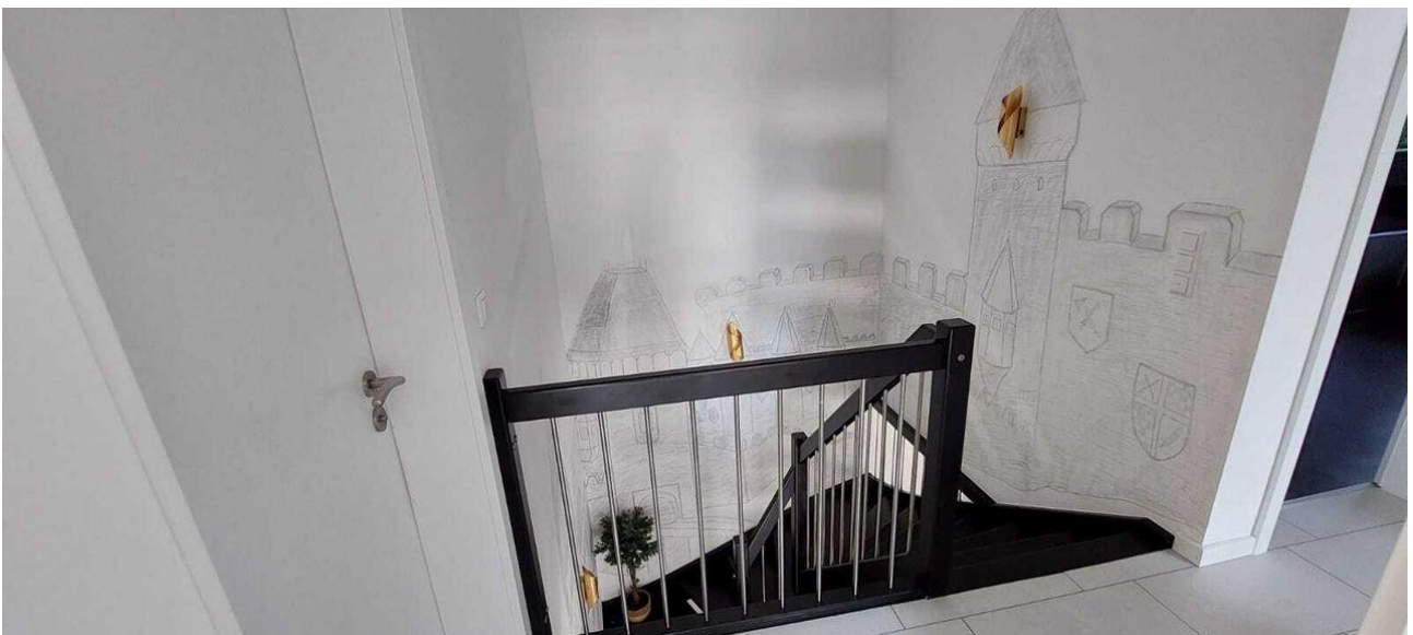
Treppenhaus Ansicht oben