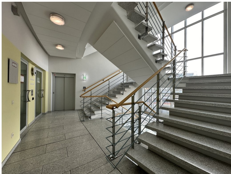
Treppenhaus und Aufzüge