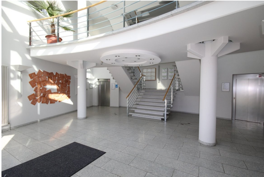
Eingangsfoyer Ansicht 2