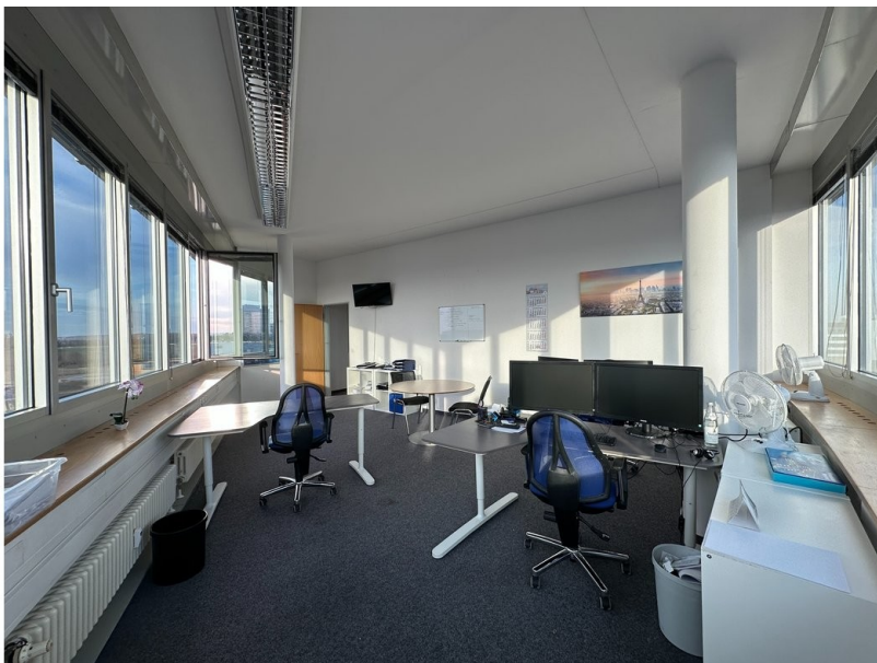
Büroraum - Ansicht 3