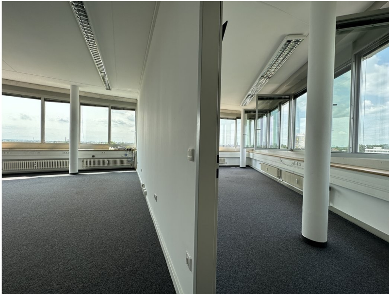
Büro mit Trennwand