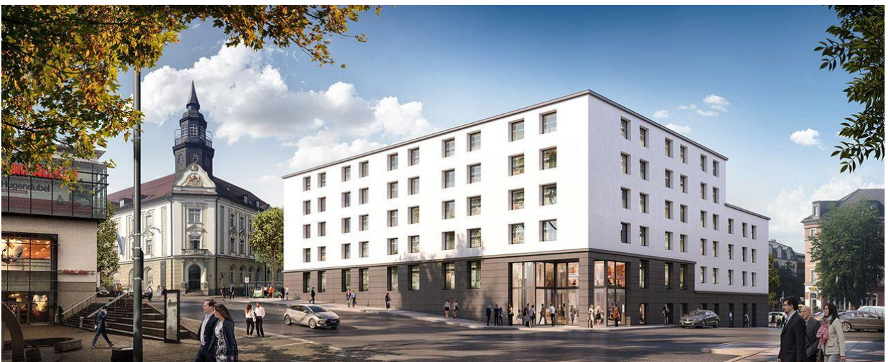
Kampeo - Gewerbeflächen in Kempten