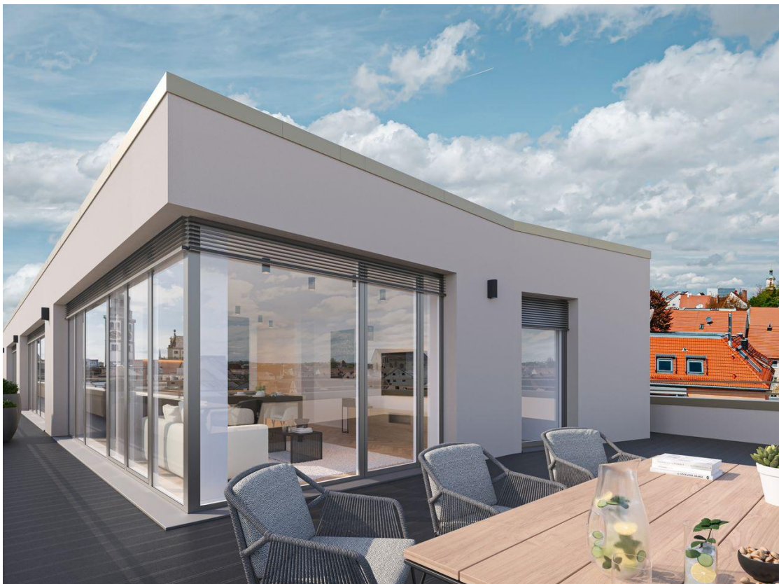
Penthouse Terrasse Rend 3