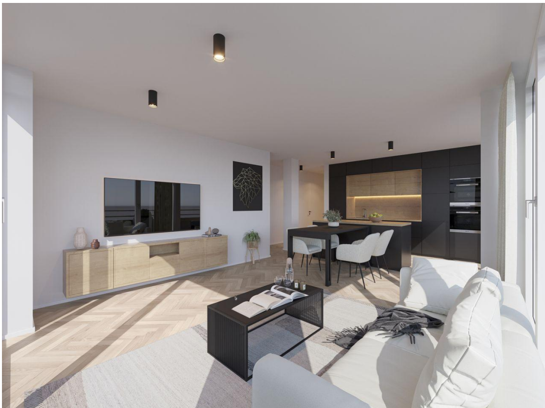
Penthouse Rend 2