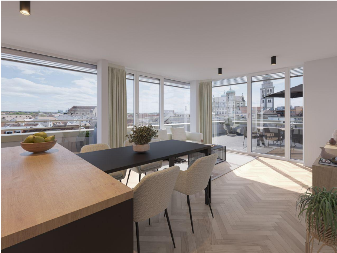
Penthouse Rend 1