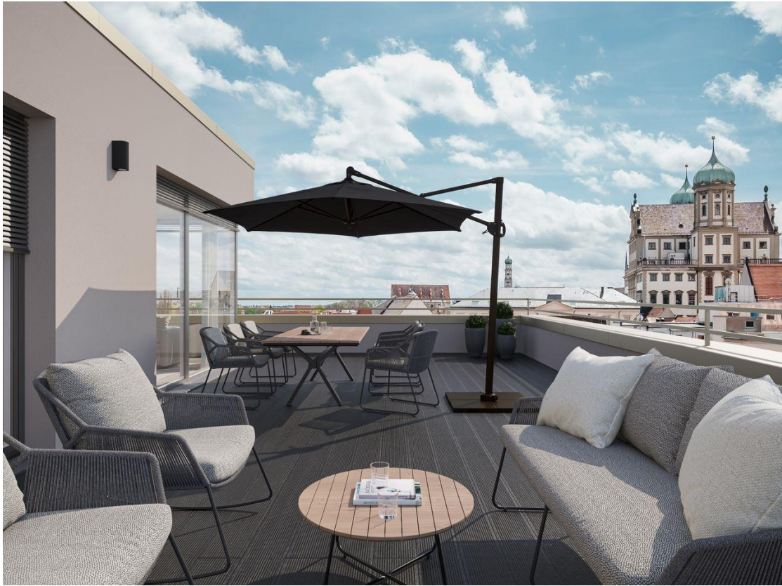
Penthouse Terrasse Rend 2