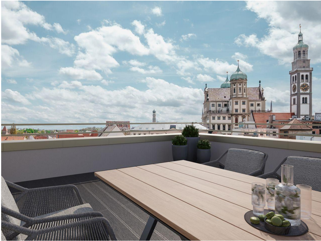
Penthouse Terrasse Rend 1