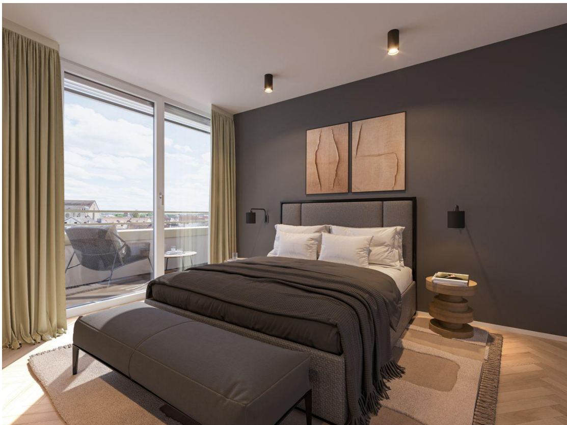
Penthouse Schlafen Rend 1