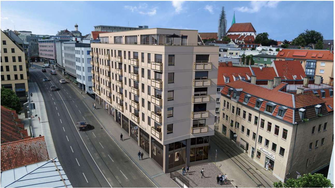
Darstellung in der Visualisierung