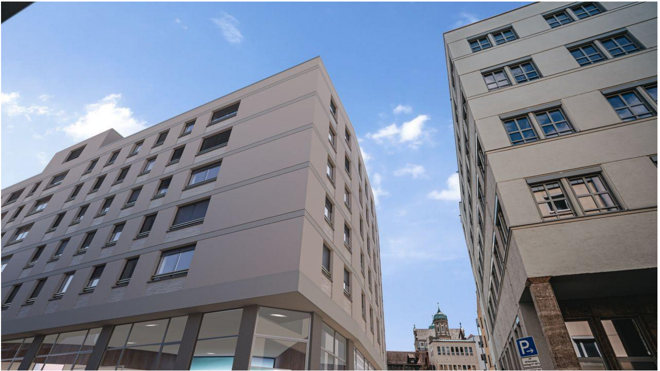
Darstellung in der Visualisierung