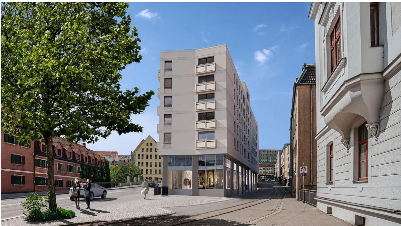
Darstellung in der Visualisierung