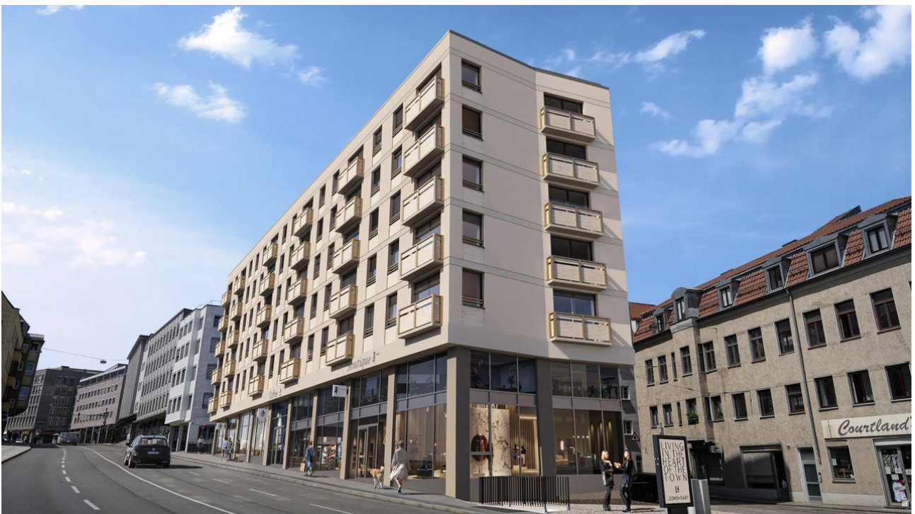
Darstellung in der Visualisierung