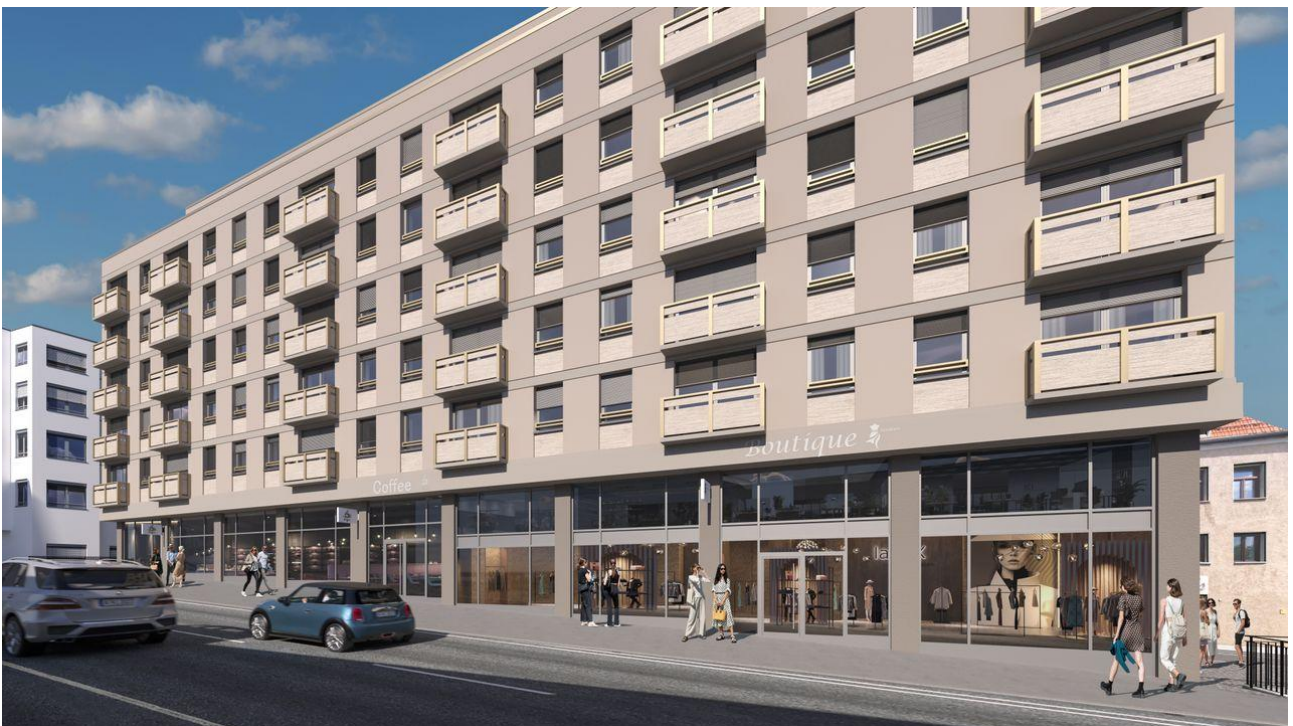
Darstellung in der Visualisierung