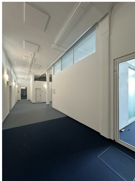
Zugang zu den Büroflächen