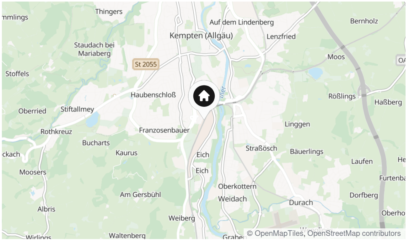
Die Karte zeigt den ungefähren Standort der Immobilie