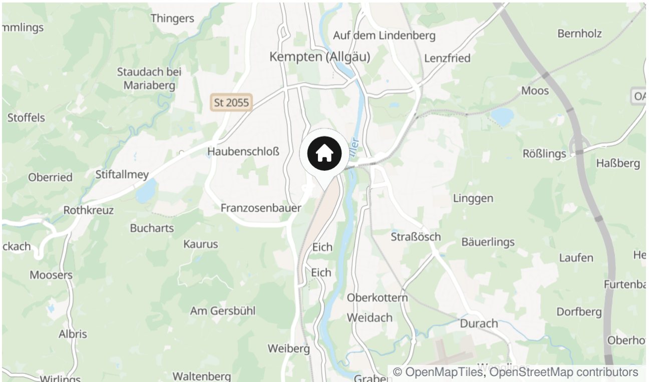
Die Karte zeigt den ungefähren Standort der Immobilie