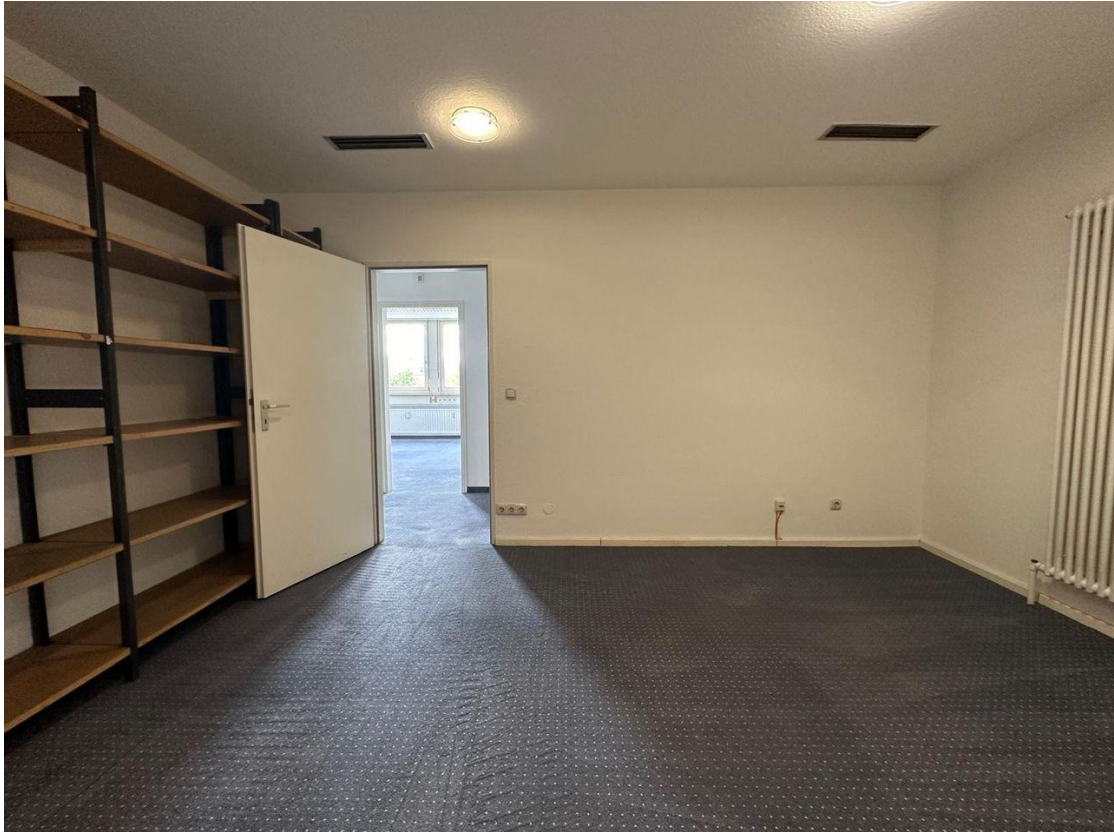
Lager- / Aktenraum