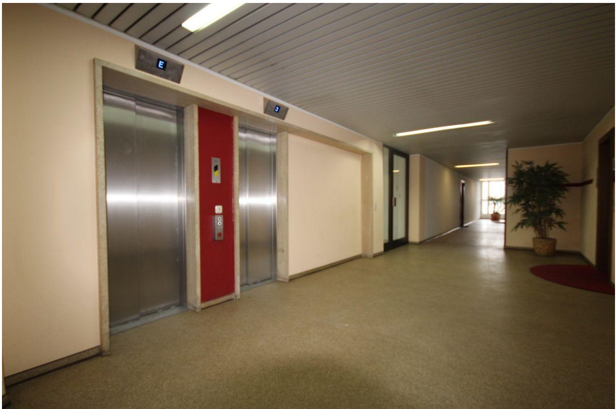
mit Aufzug (barrierefrei)