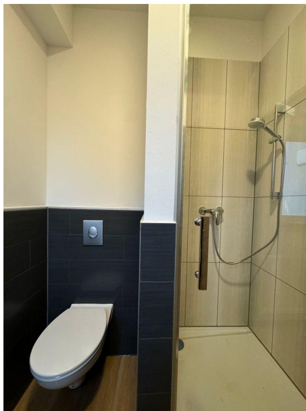
WC & Dusche Hotel