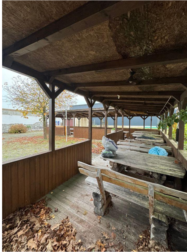
Biergarten Sitzplätze überdacht