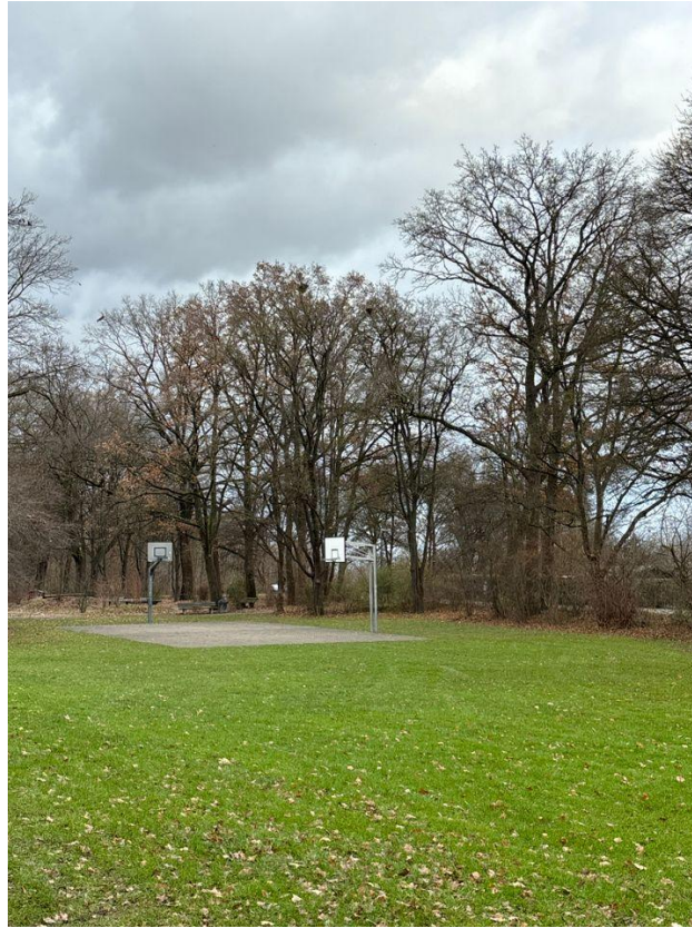
Parkanlage hinter dem Gebäude