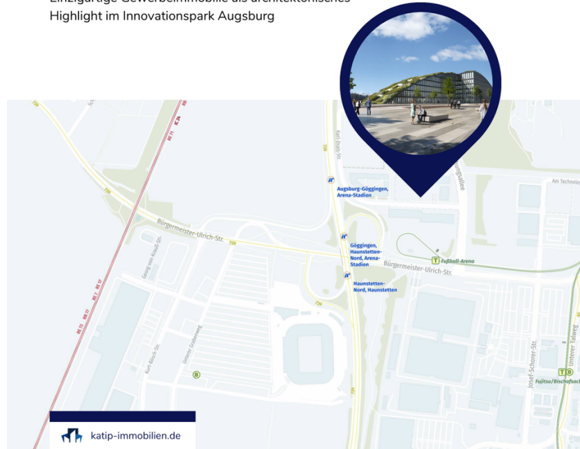
Location Map - Innovationsbogen

Einzigartige Gewerbeimmobilie als architektonisches Highlight im Innovationspark Augsburg