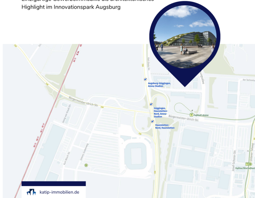
Location Map - Innovationsbogen

Einzigartige Gewerbeimmobilie als architektonisches Highlight im Innovationspark Augsburg