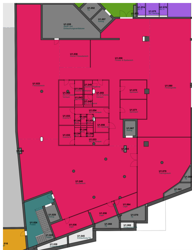
Gewerbe IV - ca. 830 m 2