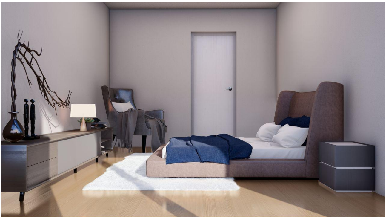
int_Photo - 6