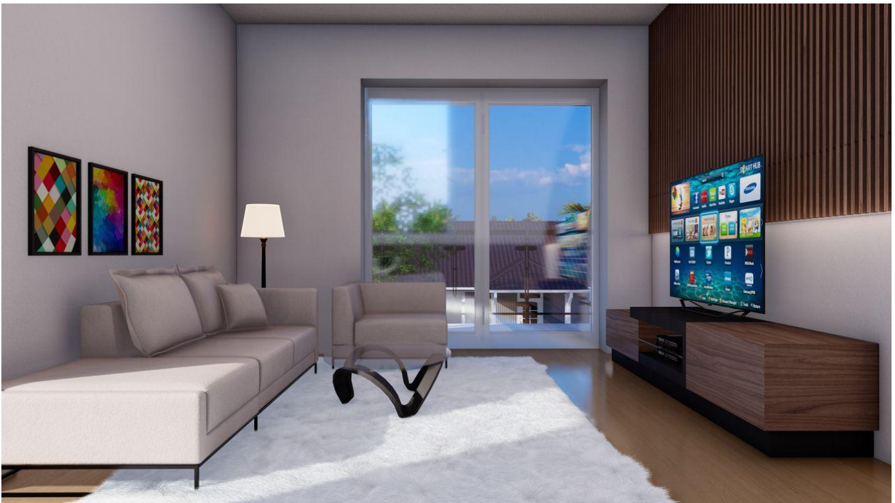
int_Photo - 1