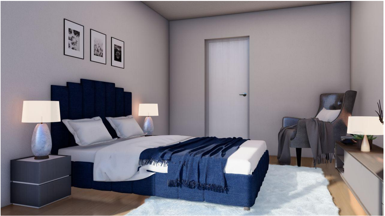
int_Photo - 5