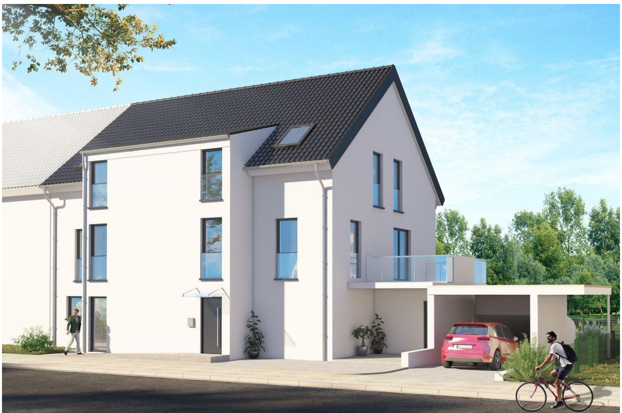
Phönix Wohnbau - Beethovenstr_Cam 2_Revised