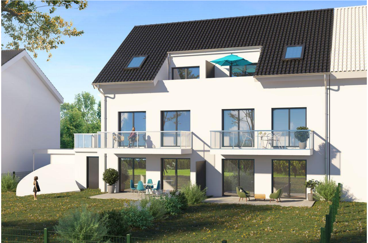
Phönix Wohnbau - Beethovenstr_Cam 1_Revised